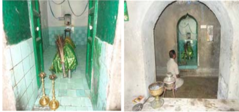
தைக்கால் தோற்றம் (புதுசத்திரம் வழியில் உள்ளது)