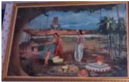
பாபாஜி பிறந்த இடம்