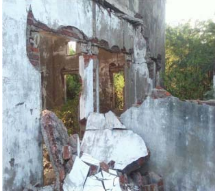
தற்போதுள்ள இடம் - இரும்பு தொழிற்சாலை