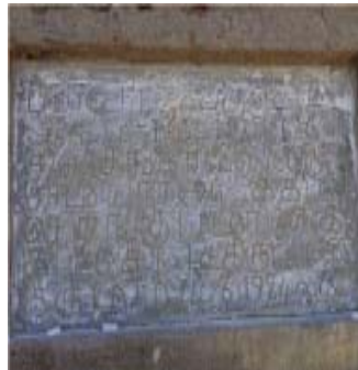
மவுனகுரு (கடல்வாழ் உயராய்வு மைய வளாகத்திற்குள் உள்ளது)