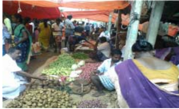
வியாழன் தோறும் வாரச்சந்தை