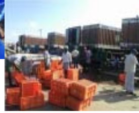
மீன்கள் கேரளாவுக்கு ஏற்றுமதி செய்யப்படுகிறது