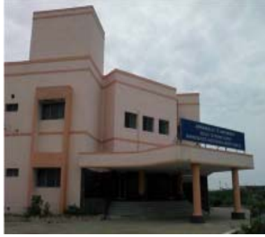
நூலகம் மற்றும் கலையரங்கம்