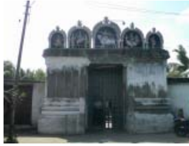
செட்டிக் கோயில் (சிவன்)