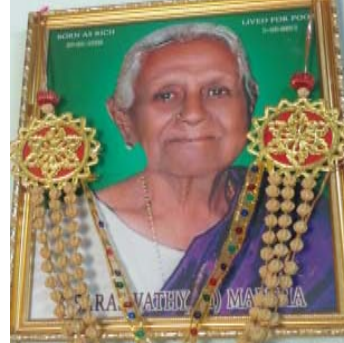
சேவாமந்திரில் இருந்த பெரிய அக்கா