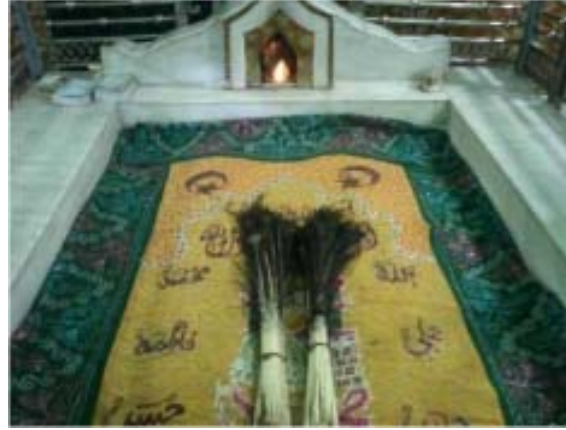
உக்காஸ் (தீப விளக்குடன்) அடக்கஸ்தலம்