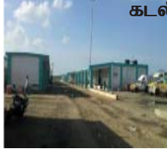
புதிதாக கட்டப்பட்டுள்ள மீன் ஏலம் விடும் இடம்