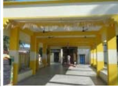
பாபாஜி கோயிலின் முன்பகுதி