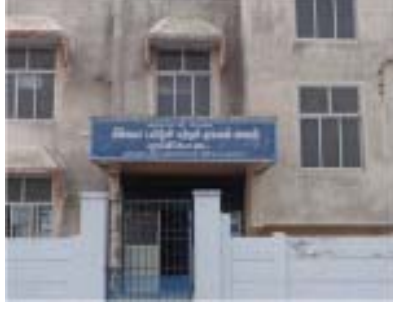
தமிழ் நாடு மின்வளத்துறை