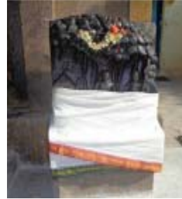
சித்தர் முருகன் பாபாஜிக்கு காட்சி அளித்தது