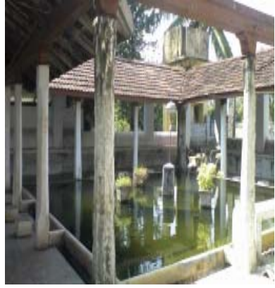
உமறுபுலவர் சீராப்புராணம் இயற்றிய இடம்