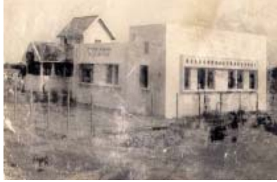
1956 ஆம் ஆண்டு சிறிய துறையாக கடல் உயிரியல் உயராய்வு மையம் துவங்கப்பட்டது