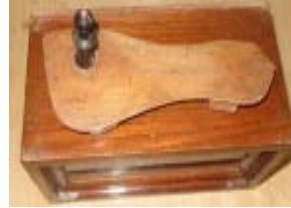
மகாத்மா காந்தியடிகளால் கொடுக்கப்பட்ட மிதியடி இப்பொழுதும் சேவாமந்திரில் உள்ளது