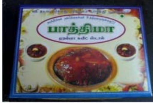
பிரபலமான ஹல்வா (அல்வா)