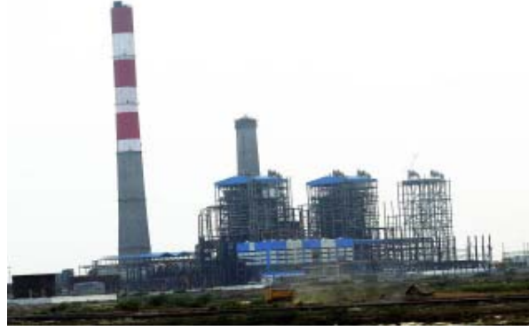
ILFS – அனல்மின் நிலையம்