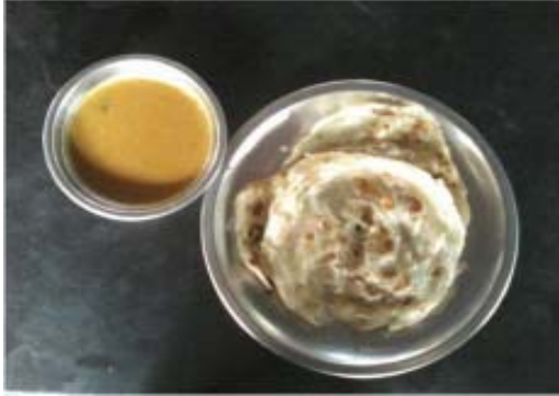
சுவையான பரங்கிப்பேட்டை பரோட்டா