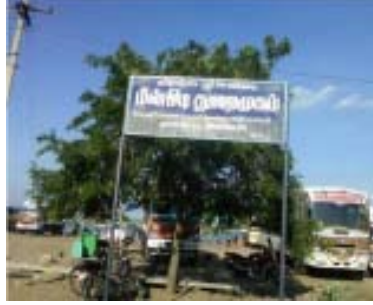
மின்பிடி துறைமுகம் - அள்ளி கொடுக்கும் கடல் அன்னை, அன்னங்கோயில்