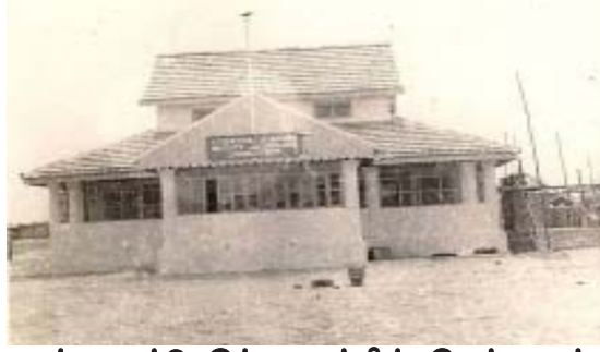
1955 ஆம் ஆண்டு இம்மையத்தில் இருந்த கட்டிடம்