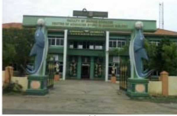
தற்போது உள்ள கடல் உயிரியல் உயராய்வு மையத்தின் முகப்பு தோற்றம்