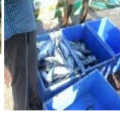
தினசரி மீன் தொழில்